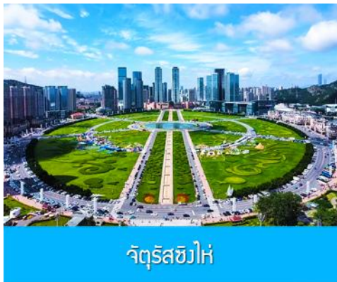
จัตุรัสชิงไห่

รับประทานอาหารเช้า ณ ห้องอาหารของโรงแรม (10)