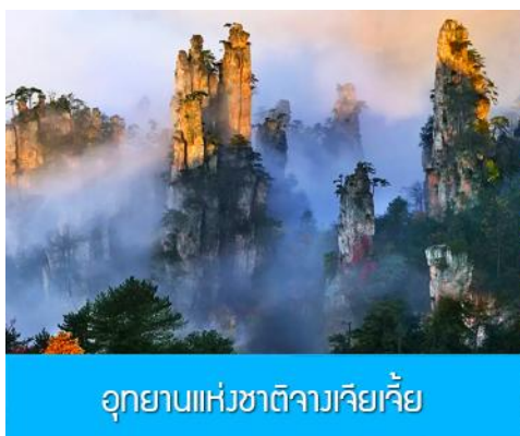
อุทยานแห่งชาติจางเจียเจี๋ย

พักที่ TUWANGJU HOMESTAY โฮมสเตย์ในเมืองโบราณผู่หรงเจิน