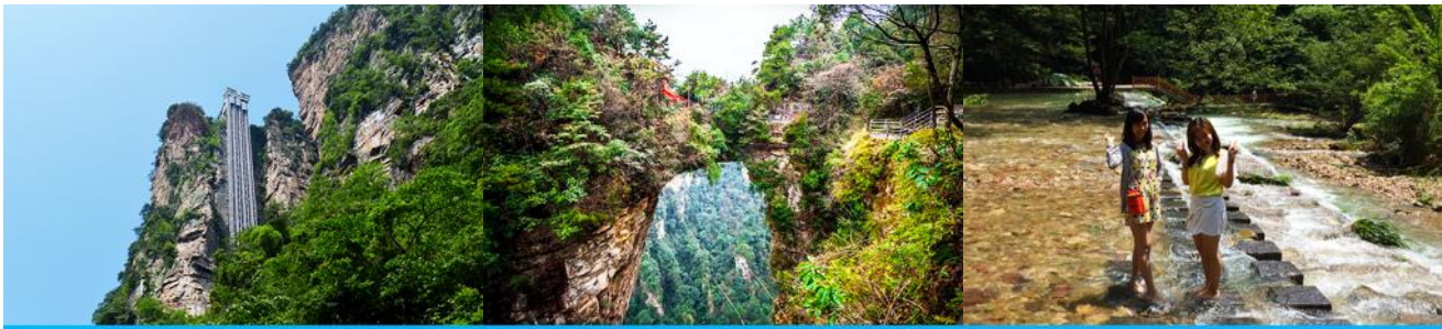
ลิฟท์แก้วไปหลวม