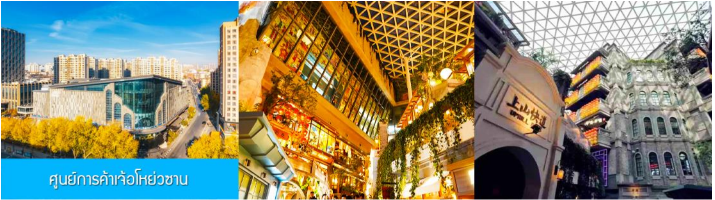
ศูนย์การค้าเจ้อหย่วซาน

นำท่านเที่ยวชม ศูนย์การค้าเจ้อหย่วซาน 这有山 แหล่งช้อปปิ้งจีนชื่อดังที่ผสมผสานระหว่างสถานที่ท่องเที่ยวและแหล่งรวมร้านค้า และร้านแนวฟาสต์ฟู้ด อาหารพื้นเมืองร่วมสมัย ภายใต้คอนเซ็ปต์ แหล่งช้อปปิ้งบนภูเขา และบนภูเขามีแหล่งช้อปปิ้ง เป็นจุดเช็คอินยอดนิยมที่เปิดให้คนพื้นที่และนักท่องเที่ยวเข้าชมตั้งแต่ปี ค.ศ. 2019