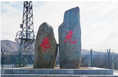
ป้ายพรมแดนจีนเกาหลีและแท่งศิลาสองพี่น้อง