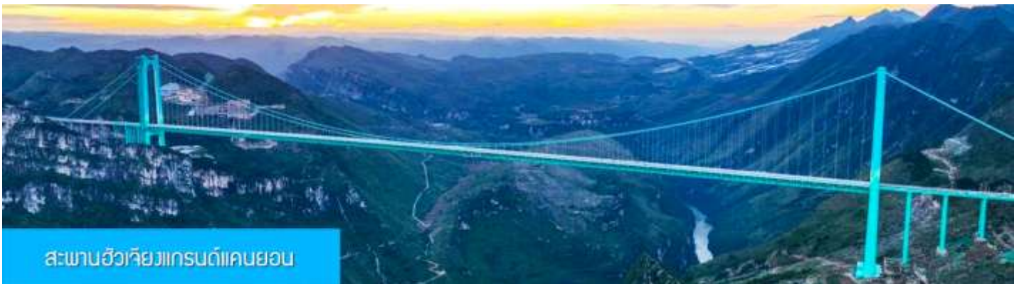
สะพานฮัวเจียงแกรนด์แคนยอน

พักที่ WINDHAM HOTEL โรงแรมระดับ 4 ดาวท้องถิ่นในเมืองอันชุ่น