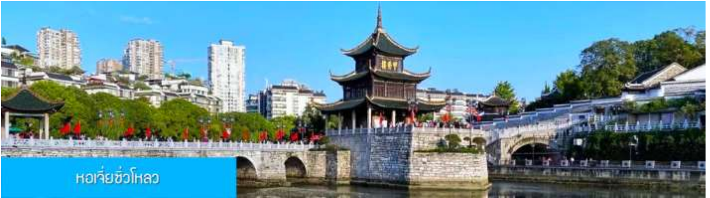
หอเจี๋ยชิวโหลว