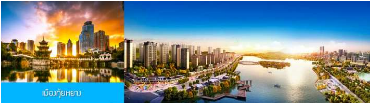
เมืองกู่หยาง