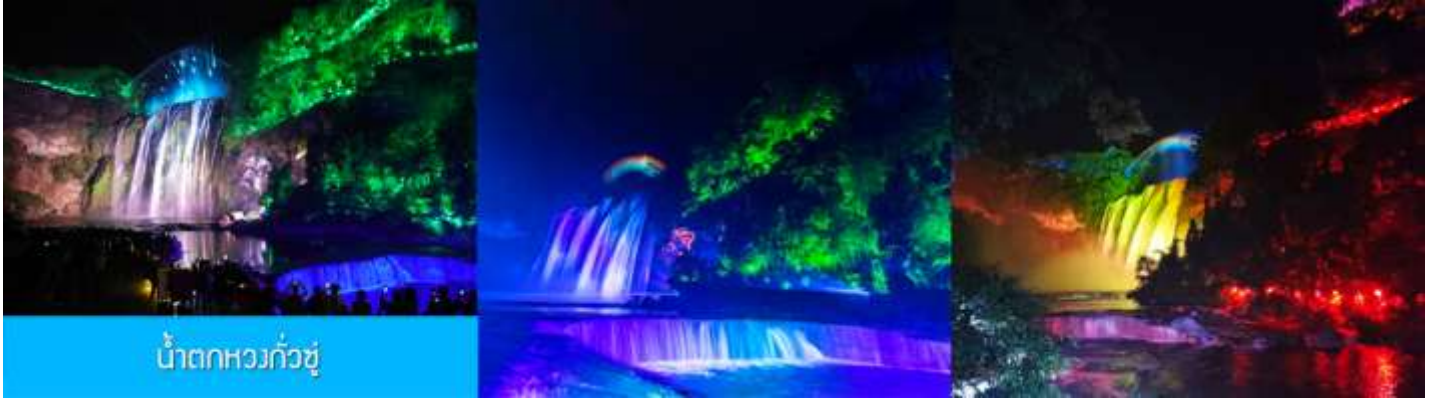
น้ำตกหวงกั๋วชู่

หลังอาหารนำท่านเที่ยวชม น้ำตกหวงกั๋วชู่ 黄果树瀑布 แหล่งท่องเที่ยวขึ้นชื่อระดับ 5A ที่ถือเป็นสัญลักษณ์ของ มณฑลกุ้ยโจว เป็นหมู่น้ำตกที่ประกอบด้วยน้ำตกน้อยใหญ่กว่าสิบแห่ง โดยมีน้ำตกหวงกั๋วชู่เป็นน้ำตกขนาดใหญ่ ที่มีความสูง 74 เมตร กว้าง 81 เมตร เป็นน้ำตกหลักของอุทยาน ชมความสวยงามของน้ำตกที่ประดับด้วย แสงสีและเลเซอร์ยามค่ำคืน ที่แต่งแต้มความมหัศจรรย์แก่อุทยานแห่งนี้ (ค่าทัวร์รวมค่ารถรับส่ง รวมค่าบันได เลื่อนขาลง และขาขึ้นภายในอุทยาน)