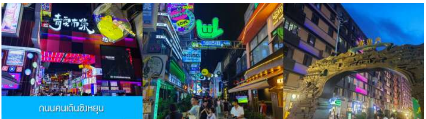
ถนนคนเดินชิงหยุน

หลังอาหารนำท่านเที่ยว ถนนคนเดินชิงหยุน 青云市集 เป็นย่านการค้าโบราณที่ถูกพัฒนาเป็นแหล่งรวมร้านค้าและสตรีทฟู้ดที่คึกคักใจกลางเมืองกู่หยาง ให้ท่านเพลิดเพลินกับการเดินชมหรือเลือกซื้อสินค้าพื้นเมืองในย่านการค้าที่คึกคักแห่งนี้