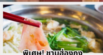
พิเศษ! ซาบูฮ่องกง