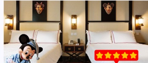
พัก Disney Explorers Lodge 5 ดาว 1 คืน