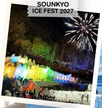
SOUNKYO ICE FEST 2027