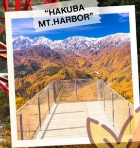
"HAKUBA MT. HARBOR"

วันเดินทาง 28 ต.ค. - 3 พ.ย. 2569 4 - 10 , 11 - 17 พ.ย. 2569