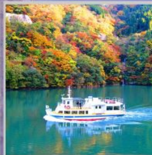
"SHOGAWA YURAN CRUISE"