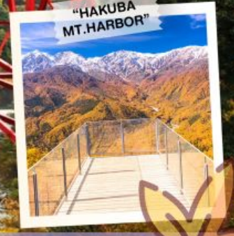
"HAKUBA MT. HARBOR"