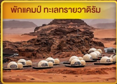
พักแคมป์ ทะเลทรายวาดีรัม