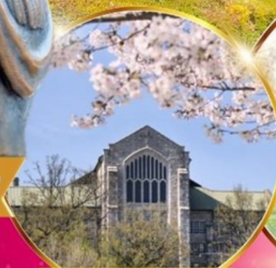
มหาวิทยาลัยสตรีอีฮวา