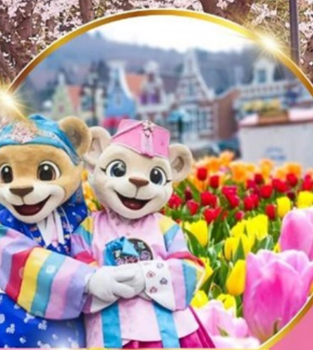
สวนสนุกเอเวอร์แลนด์