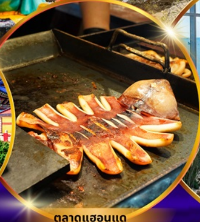
ตลาดแฮอนแด