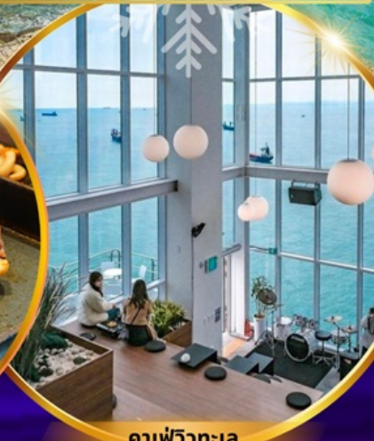
คาเฟ่วิวทะเล

ถ่ายรูปชิคๆ หมู่บ้านวัฒนธรรมคัมซอน เชคอิน คาเฟ่ริมทะเล วิวหลักล้าน ขึ้นเคเบิลคาร์ ชมทะเลปูซาน นั่งรถไฟปิ๊กปิ๊ก sky capsule ห้ามพลาด!! ตลาดปลาที่ใหญ่ที่สุด ชิมของอร่อยที่ตลาดแฮอนแด อิสระช้อปปิ้ง Lotte Duty Free