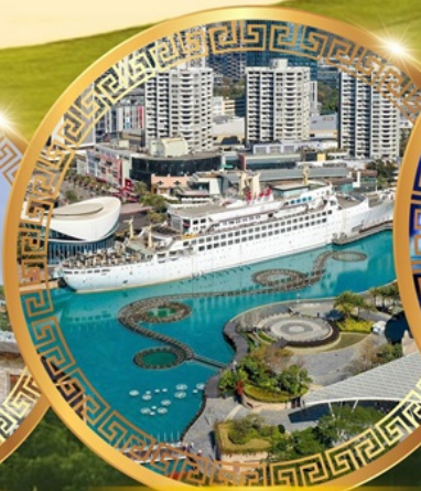
ท่าเรือ Sea World