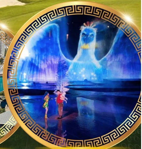
การแสดงม่านน้ำ