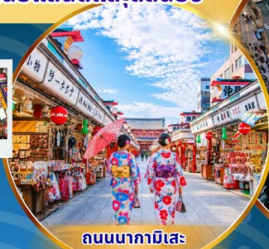
ถนนนากามิसे