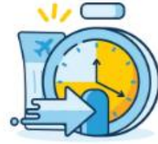
Check-in Time Limit