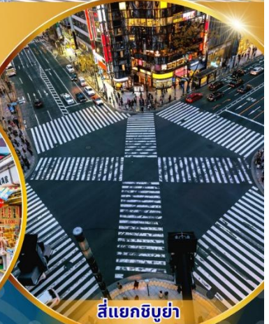
สีแยกชิบูย่า