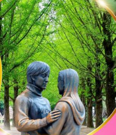
เกาะนามิ

สนุกสุดมันส์ สวนสนุกลีอตเต้เวิร์ล เชคอินเกาะนามิ สวยทุกฤดู