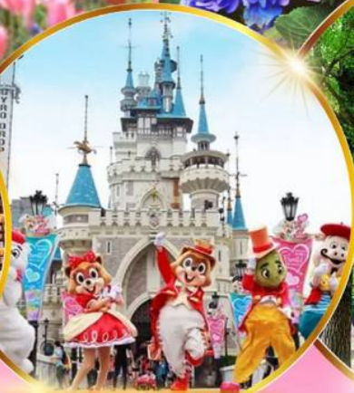
สวนสนุกลีอตเต้เวิร์ล