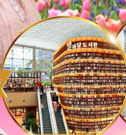
ห้องสมุดสตาร์ฟิลด์