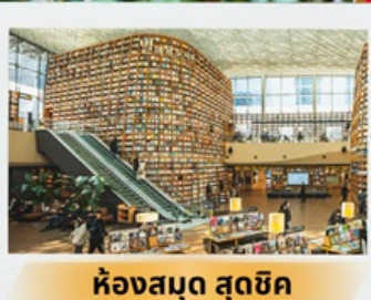
ห้องสมุด สุดชิค