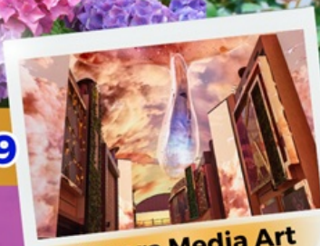
Aurora Media Art