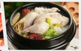
อาหารวังหลวงไก่ตุ๋นโสม