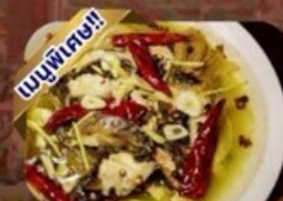
ปลาต้มพริกทอด