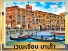
เวเนเซียน มาเก๊า