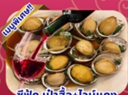
ซีฟู้ด เป้าอ้อ+ไวน์แดง