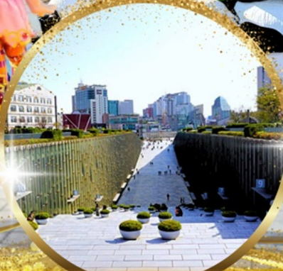
มหาลัยหญิงอีวา