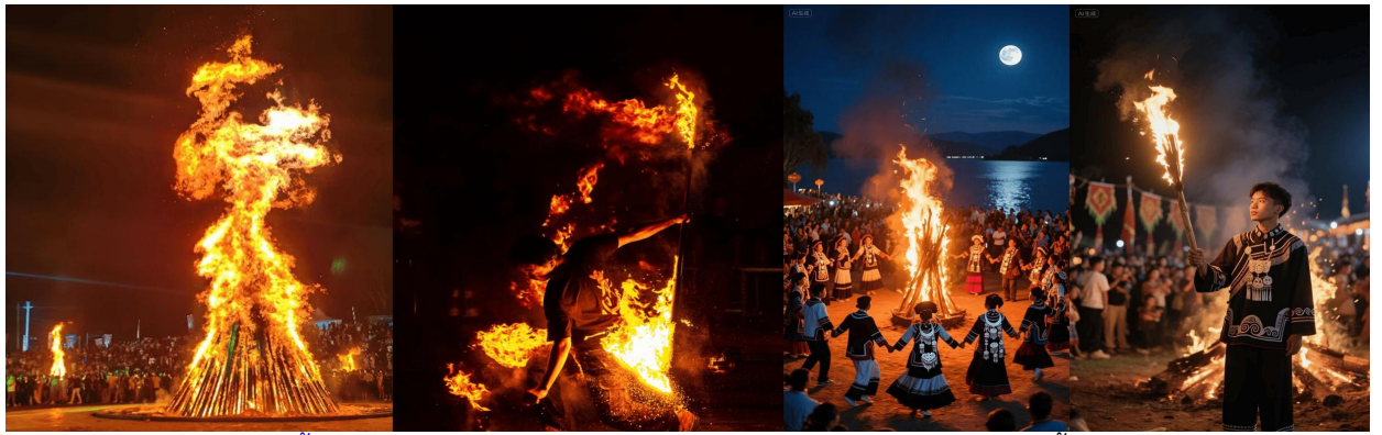
นำท่านร่วม กิจกรรมงานเลี้ยงรอบกองไฟ มรดกทางวัฒนธรรมอันทรงคุณค่า ผสมผสานวัฒนธรรมดั้งเดิมเข้ากับบรรยากาศการเฉลิมฉลองที่อบอุ่น