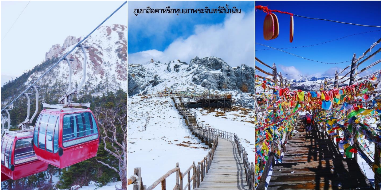
ภูเขาสีอูซ่าหรือหุบเขาพระจันทร์สีน้ำเงิน

URGENT! เส้นทางนี้...เดินทางสู่พื้นที่สูงมากกว่า 2,500 เมตรจากระดับน้ำทะเล เนื่องจากมีความดันอากาศและออกซิเจนลดลง อาจเกิดการแพ้ที่ราบสูงได้ หากมีอาการกรอกรับแจ้ง ไกด์หรือหัวหน้าทัวร์