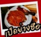
เป็ดย่างซีอาน