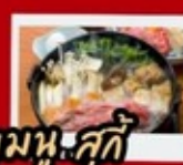
เมนูสุกี้

สุสานทหารดินเผาจีนซี ถ้ำหลงเหมิน ถนนวัดบรมบรรพตราชวงศ์ถัง ถนนคนเดินประตูโบราณลี่จิ้นเหมิน กำแพงเมืองโบราณ ร้าน POP MART วัดเส้าหลิน ป่าเจดีย์ ชมการแสดงกังฟู