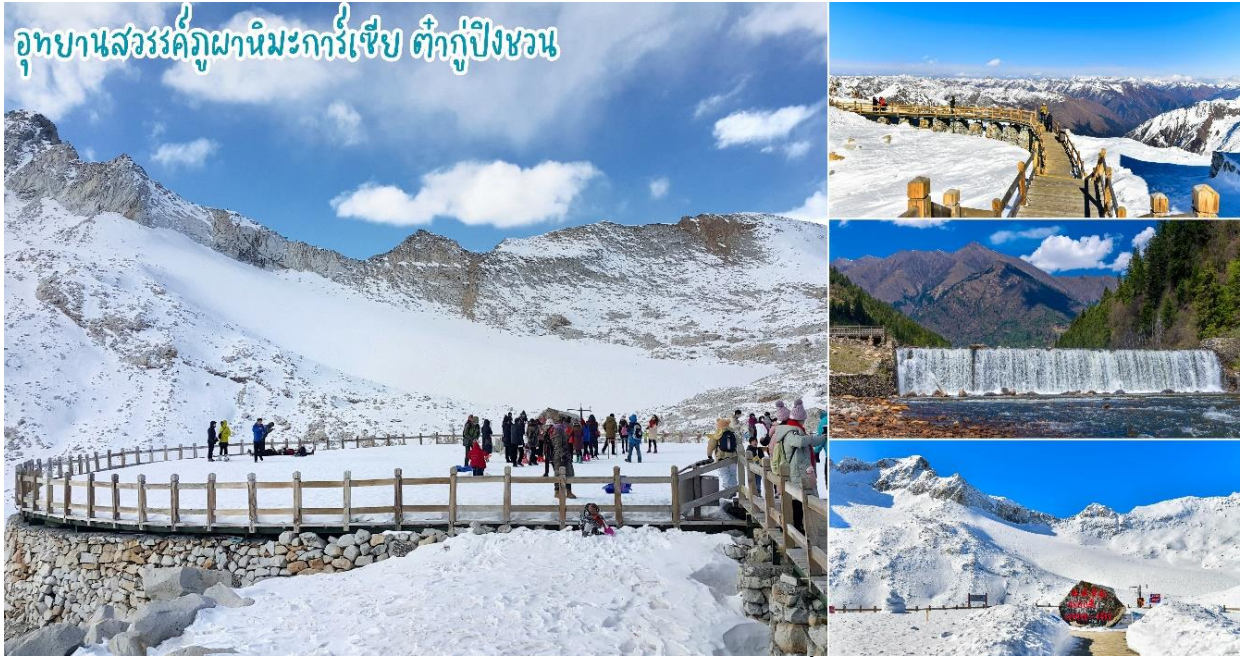
สะท้อนเข้าสู่ สายตาตั้งได้นั่งกระเช้าชมภูเขาสวรรค์ที่หาชมได้ยากยิ่งนัก จากนั้นเดินทางสู่เมืองเฉิงตู