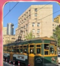
ขั้วรถรางไฟฟ้าชมเมือง