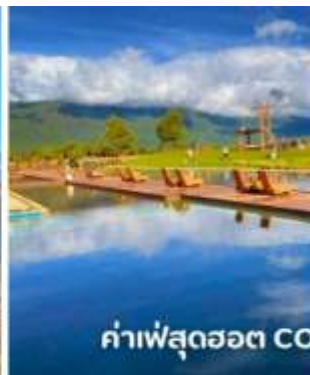
ค่าเฟ่สุดฮอต COFFEE YUN DI AN