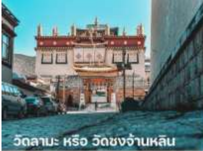
วัดลามะ หรือ วัดชงจ้านหลิน

นำท่านเดินทางสู่ลี่เจียง เป็นเมืองที่ตั้งอยู่ทางตะวันตกเฉียงเหนือของมณฑลยูนนาน ประเทศจีน ลี่เจียงเป็นเมืองโบราณสวยงามและมีประวัติศาสตร์ยาวนานกว่า 800 ปี จึงได้รับขึ้นทะเบียนเป็นมรดกโลกจากองค์การยูเนสโก (UNESCO) เมื่อปี ค.ศ. 1977 ให้เป็นมรดกโลกทางวัฒนธรรม