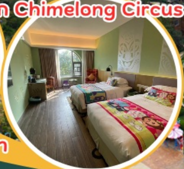
พัก Chimelong Circus 2 คืน!!