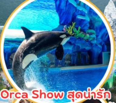
Orca Show สุดน่ารัก