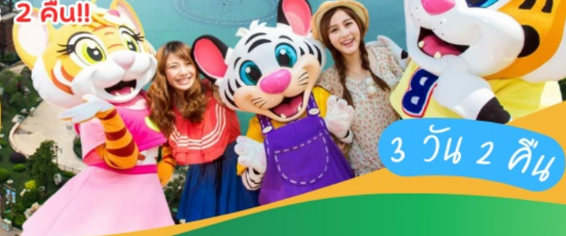
3 วัน 2 คืน