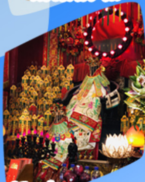
เจ้าแม่กวนอิมขี้มเงิน