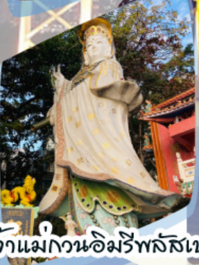
เจ้าแม่กวนอิมรัพลัสเบง