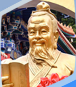
หลวงดำเซ็งน