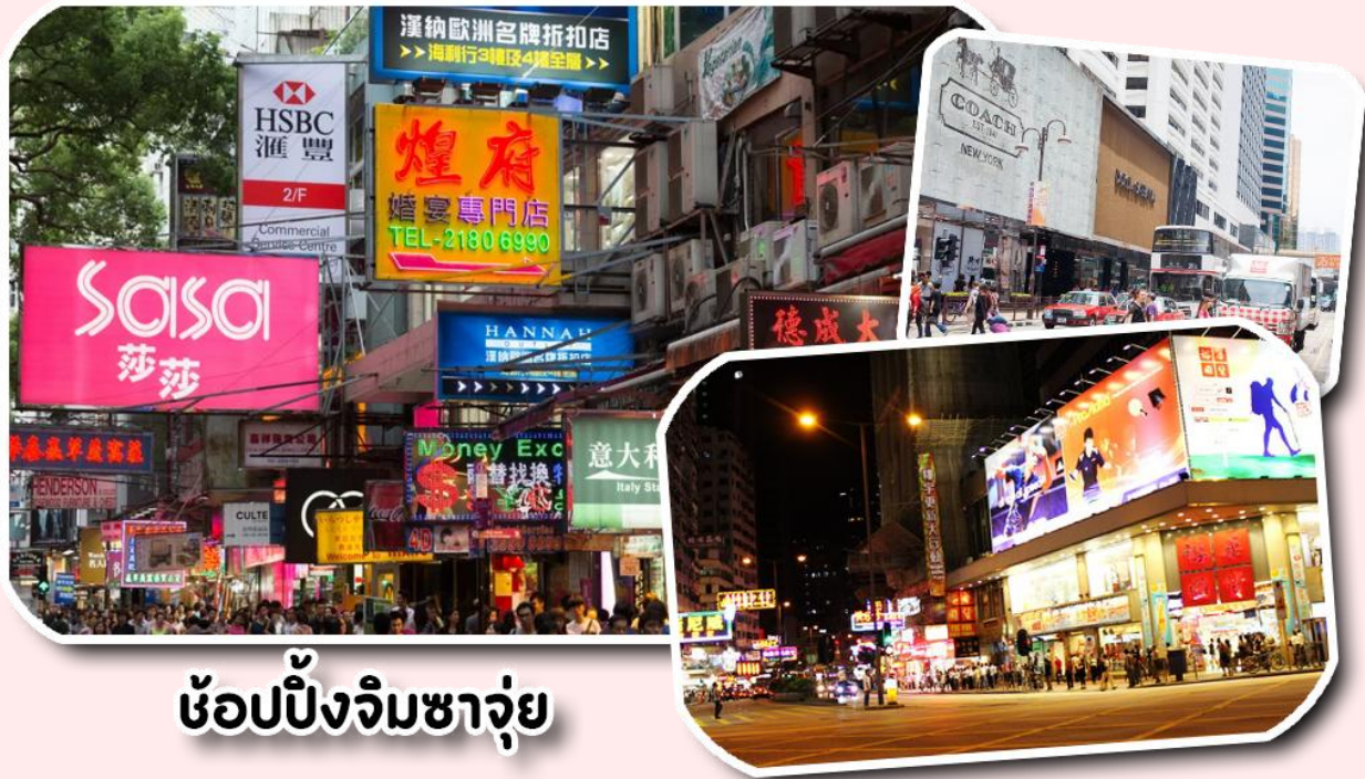
ช้อปปิ้งจิมซาจุ่ย

พาท่านช้อปปิ้ง ย่านจิมซาจุ่ย (tsim sha tsui) เป็นย่านช้อปปิ้งชื่อดังของเกาะฮ่องกง ที่คนไทยทั่ว ๆ ไปก็ต้องรู้จัก และพูดกันหนาหูติดปากมานาน ตั้งอยู่บริเวณริมอ่าววิคตอเรีย ของฝั่งเกาลูน ฮ่องกง เมื่อพูดถึงจิมซาจุ่ย ทุกคนก็ต้องนึกถึง ถนนนาธาน ซึ่งทอดยาวตั้งแต่จิมซาจุ่ยไปจนถึงย่านปรีนท์ เอ็ดเวิร์ด นับเป็นถนนสายช้อปปิ้งอย่างแท้จริง และเป็นเสน่ห์อย่างหนึ่งของฮ่องกง ที่ทั้งสองฟากฝั่งของถนน จะเต็มไปด้วยร้านค้าต่างๆ มากมาย ทั้งเสื้อผ้าแบรนด์เนมชื่อดังทั่วโลก เครื่องหนังชั้นดี ห้างสรรพสินค้าทันสมัย ร้านอาหารและภัตตาคารหรู โรงแรมตั้งแต่ระดับเกสต์เฮ้าส์ ไปจนถึงระดับ 5 ดาว