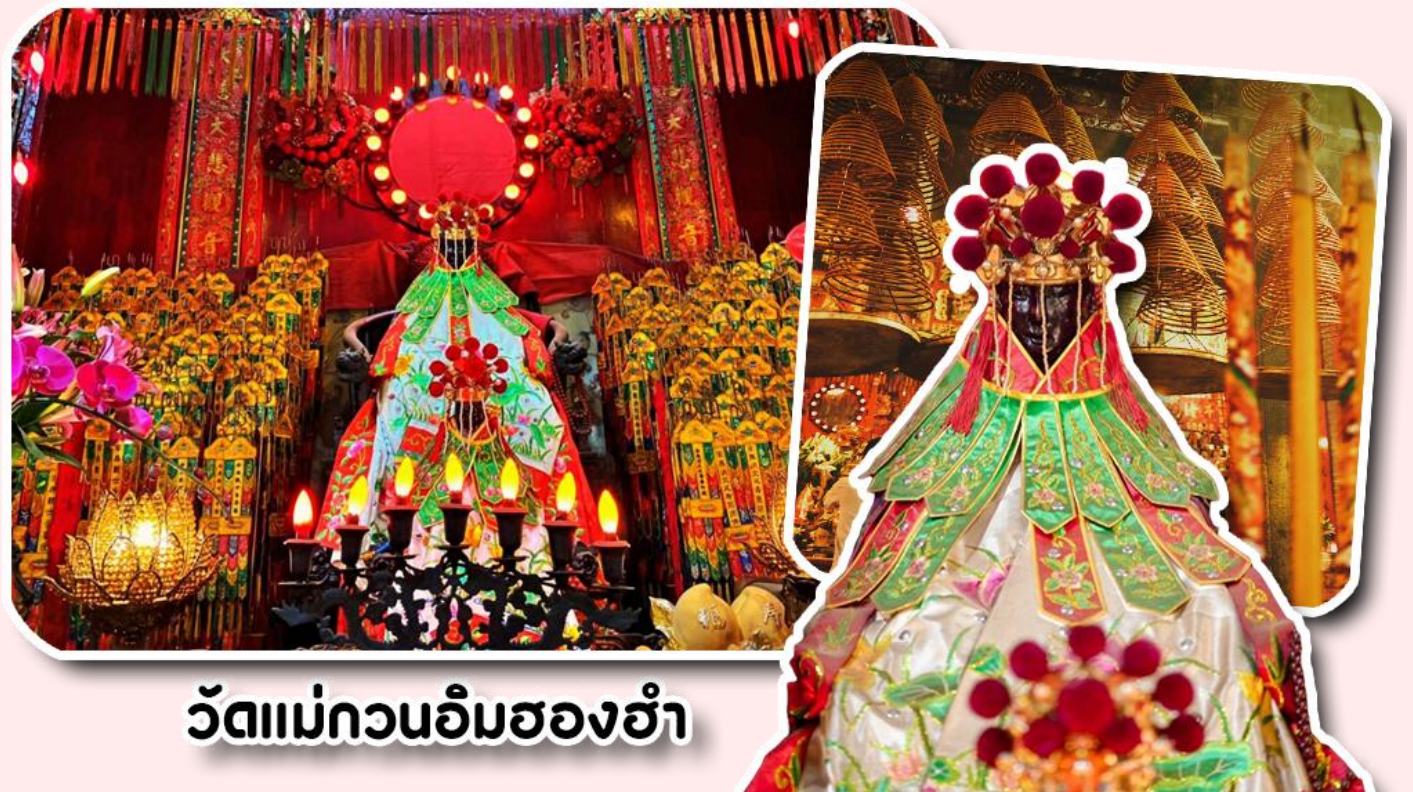
วัดแม่กวอนอิมฮองฮำ

จากนั้นพาท่านเข้าไปไหว้ขอพร วัดแม่กวอนอิมฮองฮำ วัดเก่าแก่ของฮ่องกงสร้างตั้งแต่ปี ค.ศ .1873 เป็นวัดขนาดเล็กที่มีชาวฮ่องกงศรัทธานับถือกันเป็นอย่างมากวัดแห่งนี้เป็นที่ประดิษฐาน องค์เจ้าแม่กวอนอิมฮองฮำ ที่มีชื่อเสียงเรื่องการให้กู้ยืมเงินเชื่อกันว่าท่านช่วยพลิกฟื้นเศรษฐกิจของชาวฮ่องกง ผู้คนจึงนิยมมาขอยืมเงินทำธุรกิจจนสำเร็จ ร่ำรวย รุ่งเรืองโดยให้ท่านอธิษฐานขอพรต่อหน้า เจ้าแม่กวอนอิมฮองฮำพร้อมกับระบุวันเวลาในการขอพรด้วย จากนั้นนำธูปธรรมาฐานและเครื่องเซ่นไหว้ที่เราจะนำเป็นสื่อในการขอพร เขียนจำนวนเงินที่ต้องการลงไปด้วย ใส่สกุลเงินยิ่งดีใหญ่ แล้วนำเงินใส่ในซองแดง ควรเตรียมซองแดงไปเอง นำซองแดงไปวนรอบกระถางธูป วนขวาจำนวน 3 ครั้ง แล้วเก็บซองแดงในกระเป๋าสตางค์ เป็นเงินขวัญถุง ถ้าประสบความสำเร็จตามที่มุ่งหวัง ให้นำเงินในซองแดงทำบุญหยอดตู้ที่วัดแห่งนี้ในโอกาสต่อไป