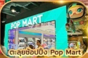
ตะลุยช้อปปิ้ง Pop Mart