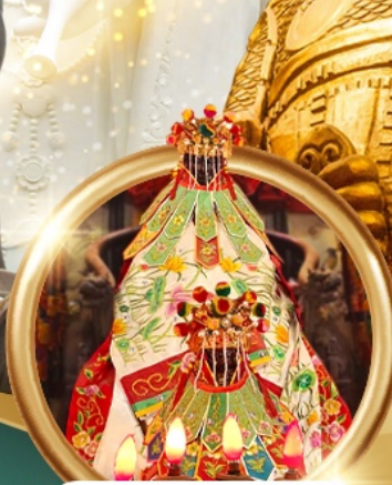
ขี้มเงินเจ้าแม่กวนอิมสองฮา