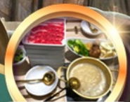
บุฟเฟ่ต์ชาบู เบียร์ไม่อั้น!!