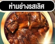
ห่านย่างสลีส