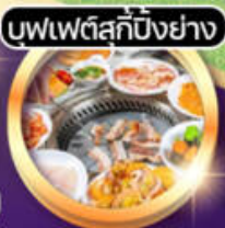
บวฟเต็ลคักปึงย่าง