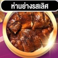
हांอย่างรสเลิศ