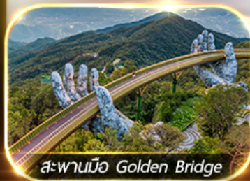
สะพานมือ Golden Bridge