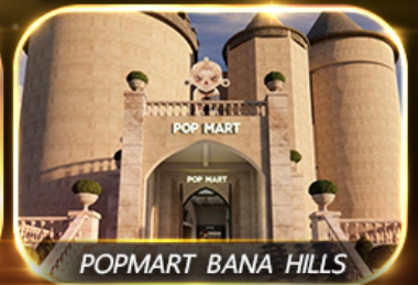
POP MART BANA HILLS

สัมพัสความงามหมู่บ้านฝรั่งเศสที่บานาฮิลล์ ซอปปิง POPMART