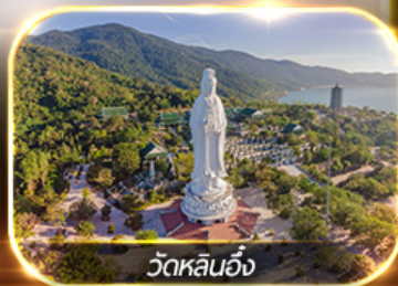
วัดหลินอึ้ง