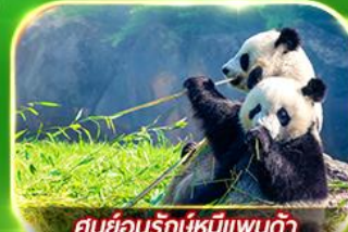
ศูนย์อนุรักษ์หมีแพนด้า