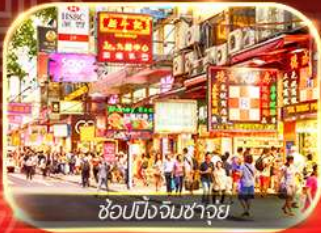
ช้อปปิ้งจิมซาจุ้ย