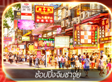
ช้อปปิ้งจิมซาจุ้ย