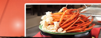
บุฟเฟ่ต์อาหารเย็น + ชาบู 1 มื้อ