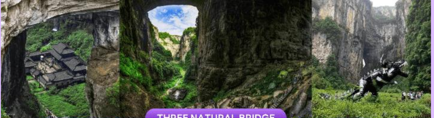
THREE NATURAL BRIDGE