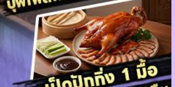
เปิดปากถึง 1 มื้อ

พักรูม 4 ดาว 3 คืน ไฮไลท์ สุดว้าว! ขึ้นลิฟต์แก้วชมความอลังการ กลางหุบเขา