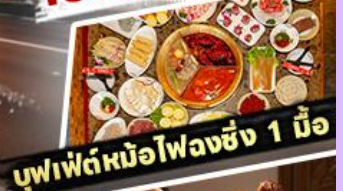
บุฟเฟ่ต์หนือโฝวงซิง 1 มื้อ