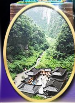
อุทยานหลุมฟ้า สะพานสวรรค์