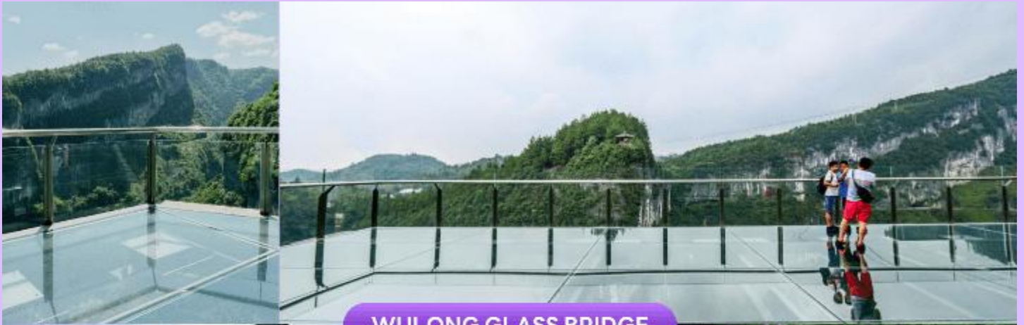
WULONG GLASS BRIDGE