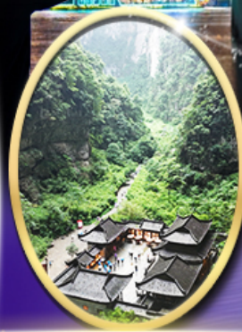
อุทยานหลุมฟ้า สะพานสวรรค์