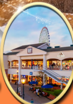
Rinku Premium Outlets