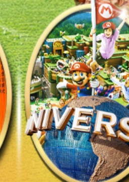
อิสระเลือกซื้อบัตร Universal Studios Japan

ไอโคโน้ พิเศษ! อิสระท่องเที่ยว 1 วันเต็ม