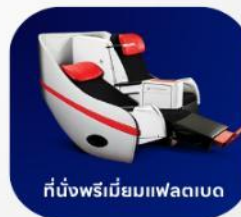
ที่นั่งพรีเมียมแพลนเบด

บริการอาหารร้อน และ น้ำดื่ม บนเครื่อง ขาไป และ ขากลับ