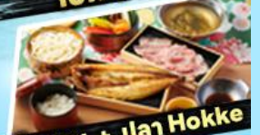
เอ๊กซาปู + ปลา Hokke

36,919 ราคา เริ่มต้น บาท รวมภาษีมูลค่าเพิ่ม 7%