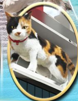
ซอยบิง ชินจุกุ