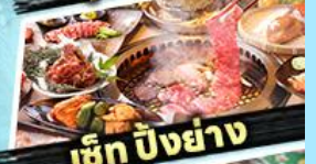
เอ๊ก บิงย่าง