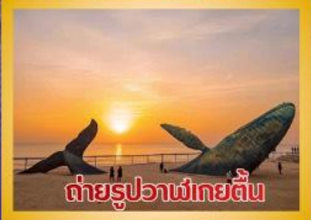
ภูเขาเหลาซาน