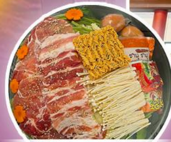
ซาบู่ ซาบู่ ฮ่องกง

พักฮ่องกง 2 คืน พักใจกลางย่านมงก๊ก วัดแชกงหมิว เจ้าแม่กวนอิมริฟลิสเบย์ วัดกวนอู วัดหวังต้าเซียน วัดฮ่องกง วัดเจ้าแม่ทับทิม