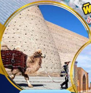
บิ่อมปราการบุคาร่า