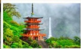
ศาลเจ้าคามาโนะนาจิ