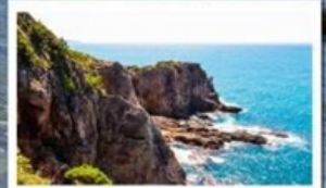
ท่าชินดินเบกิ