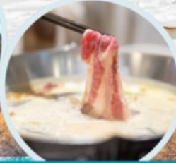
เมนูพิเศษ สุกินหม่าล่า