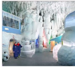
บิพิธภณฑน์น้ำแข็ง