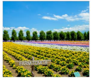
ท่งลาเวนเดอร์โทมิตะ