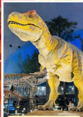
พิพิธภัณฑ์ไดโนเสาร์