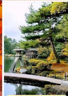
สวนเคนโรคุเอ็น