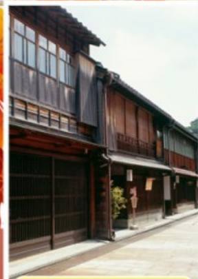
ย่านอิงาชิบายะ