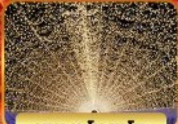
น้ำตกนิชิโนะคาโตะ