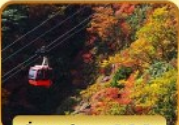
นั่งกระเช้าภูเขาโทโชไซ