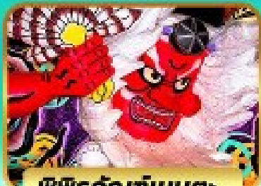
พิพิธภัณฑ์เนบูตะ