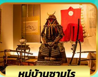
หุมุบ้านซามูโร