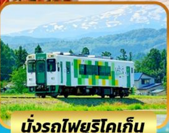
นั่งรถไฟยูริโคเกิน