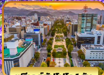
ฟรีเดย์ซิปโปโร 1 วัน