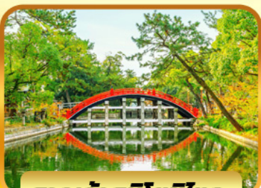
ศาลเจ้าสุมิโยชิไทวะ