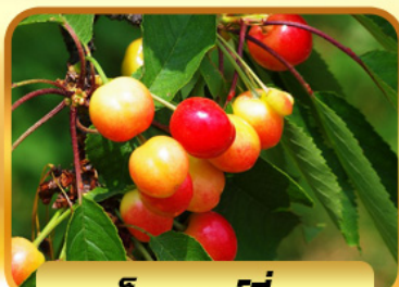
เก็บเชอร์รี่