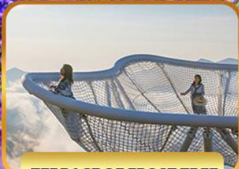
TERRACE OF FROST TREE