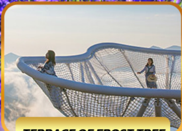
TERRACE OF FROST TREE