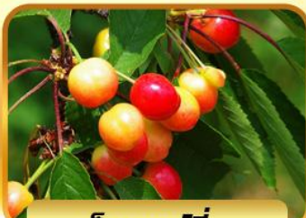
เก็บเชอร์รี่