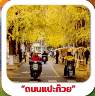
"ถนนแปะก๊วย"