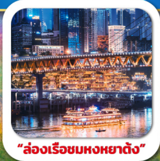
"ล่องเรือชมหงหยาดัง"